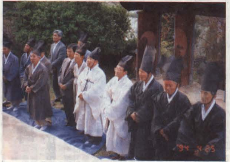
▲ 鳳陽書院 春季祭享 祭官들(1994. 4. 25)