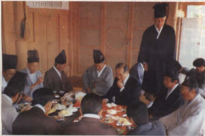
▲ 祭享을 마치고(경남 창원군 진전면 일암리)