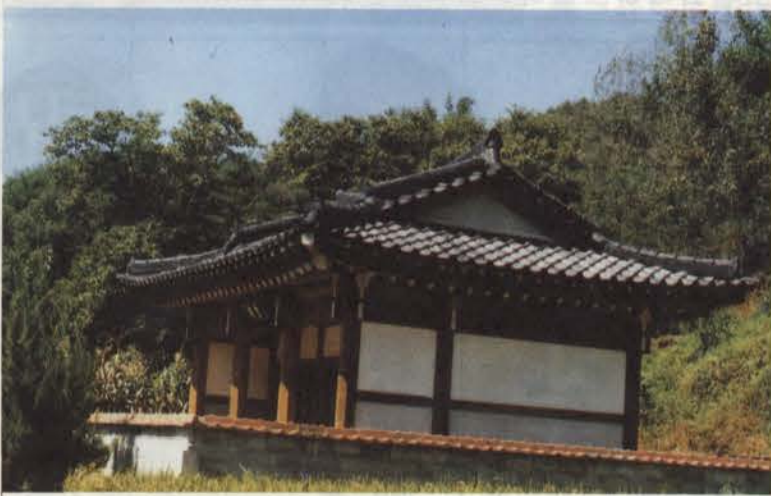
▲ 崇雲祠(강원도 횡성군 우천면 하대리 소재: 1987. 7. 30 준공)