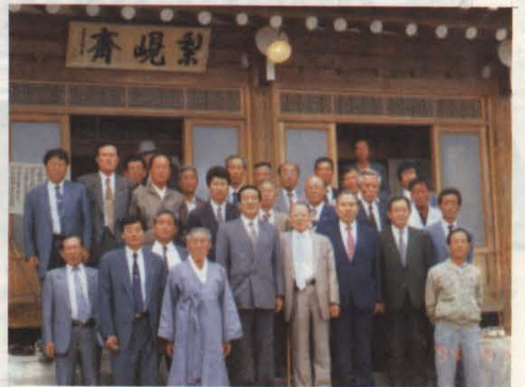
▲ 梨峴齋(1984年度 竣工)에서 三賢祭壇 立石式을 마치고 경북 의성구 구천면 이현리 소재