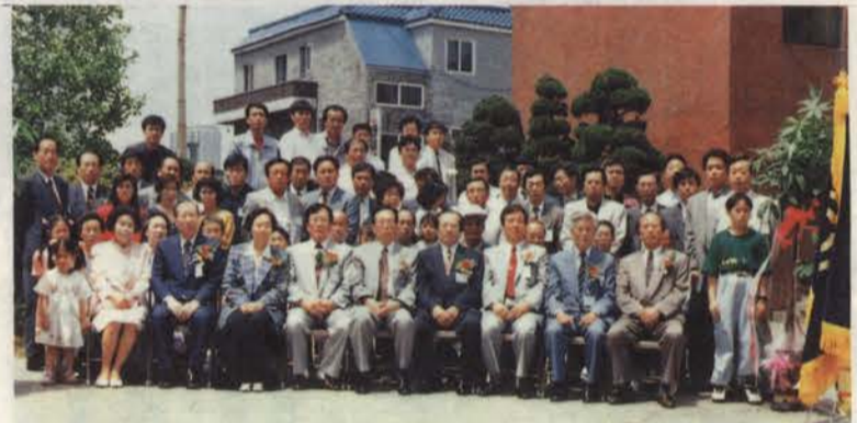
▲ 仁川宗親會 총회를 마치고(1994. 5. 22)