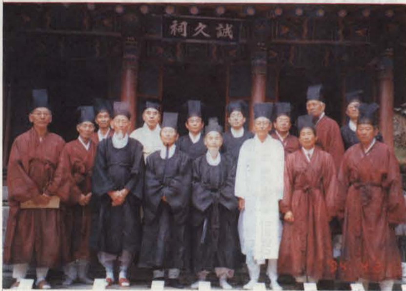
▲ 誠久祠春季祭享祭官들(1994. 4. 21)