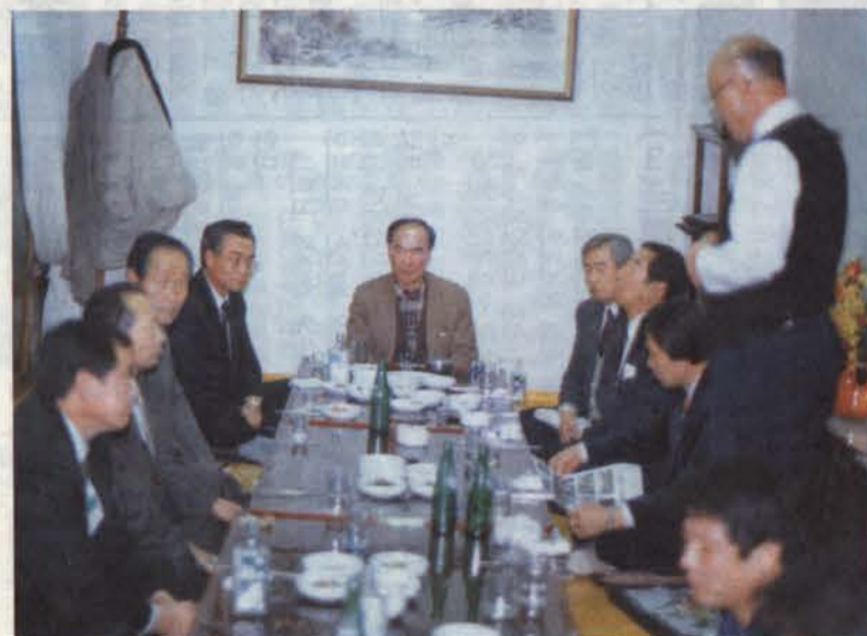
▲ 大邱宗親會 理事會(1994. 3. 16: 우연식당에서)