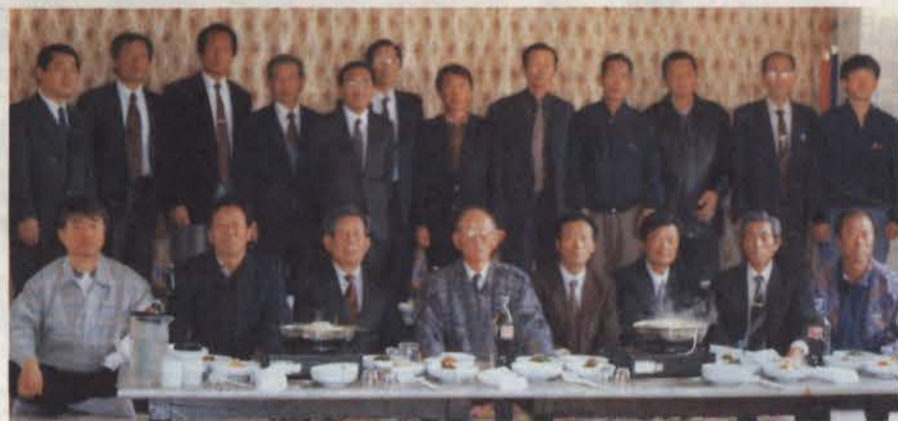
▲ 합천종친회 이사회 광경(1994. 3. 29)