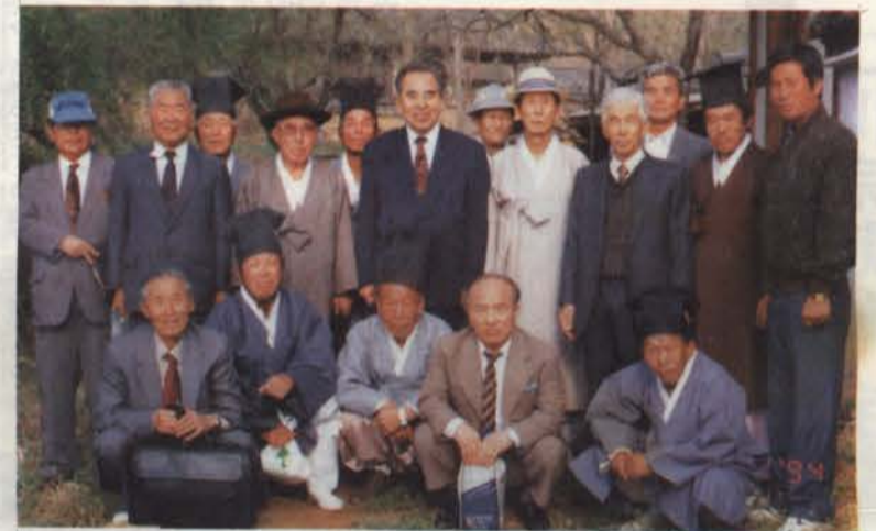
▲ 祭享을 마치고(경북 청도군 풍각면 봉기리)