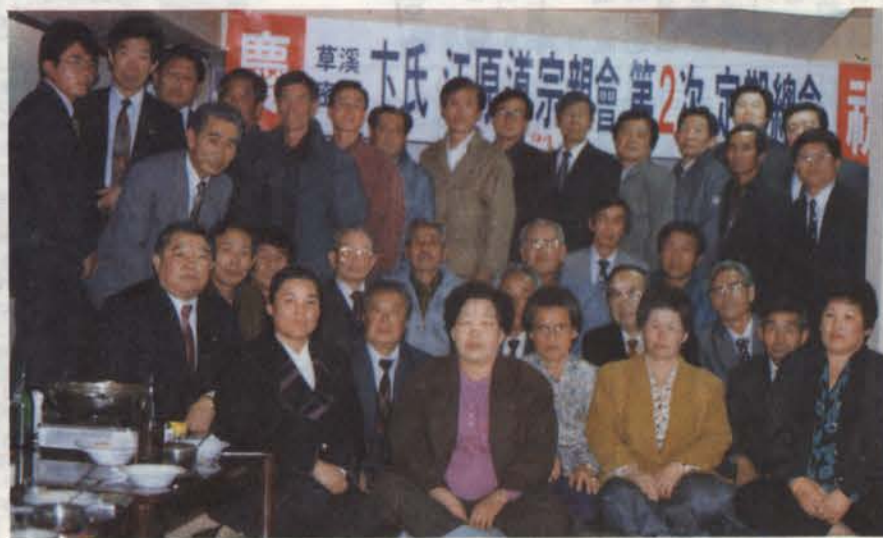
▲ 강원도 종친회 정기총회를 마치고(1994. 3. 12: 춘천에서)