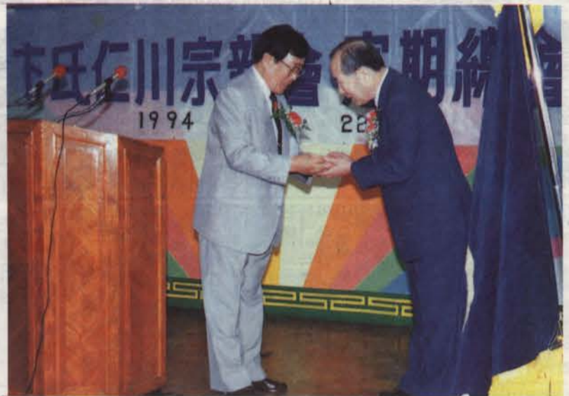
▲ 仁川宗親會 94年度 정기총회(1994. 5. 22:신·구회장 이취임식)