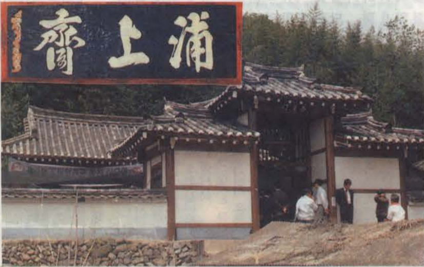
▲ 浦上齋(경남 합천군 쌍책면 상포리 소재)