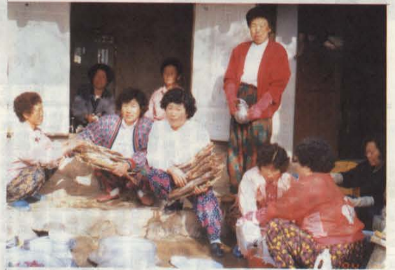
▲ 鳳陽書院(春堂·春亭 位牌奉安) 제수 준비에 수고하시는 宗婦님들