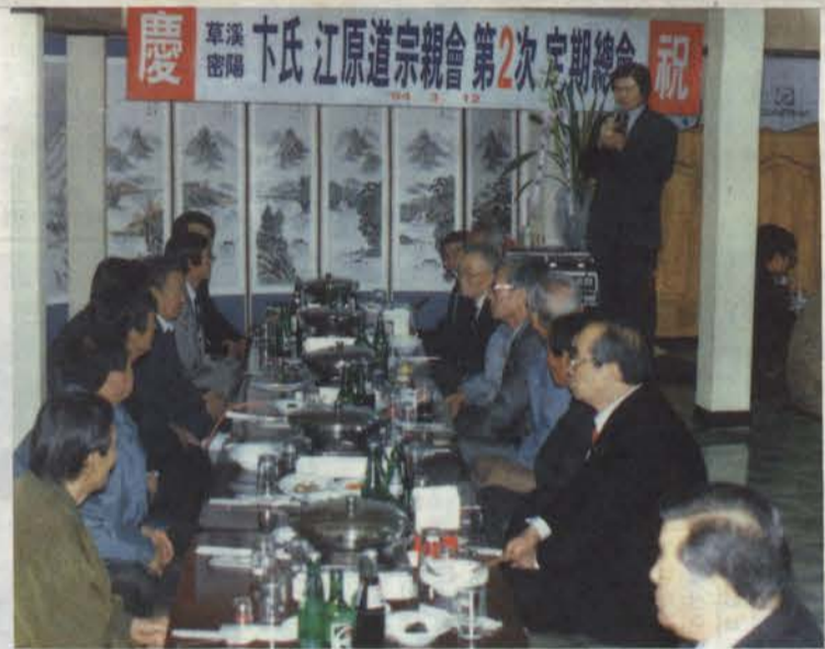
▲ 강원도종친회 제2차 정기총회 광경(1994. 3. 12)