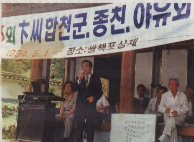
▲ 합천종친회 총회 광경(1994. 5. 1: 합천군 쌍책면 포상재에서)